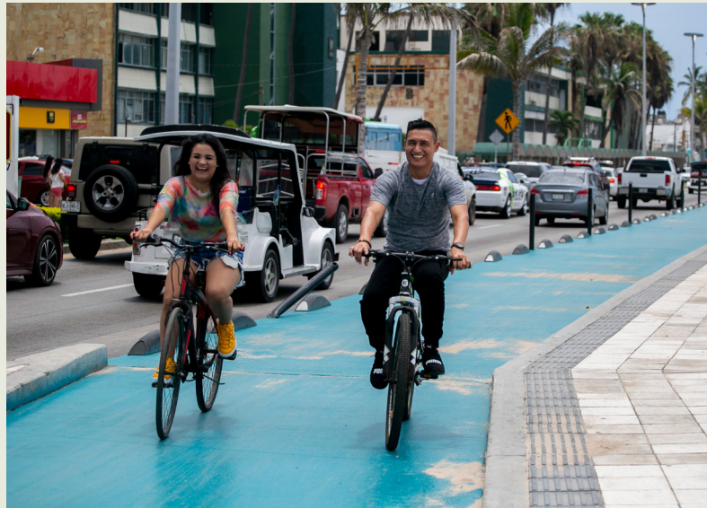
Malecón de Mazatlán, Mazatlán, Sinaloa. Foto: ITDP/Raquel Cunha 2022