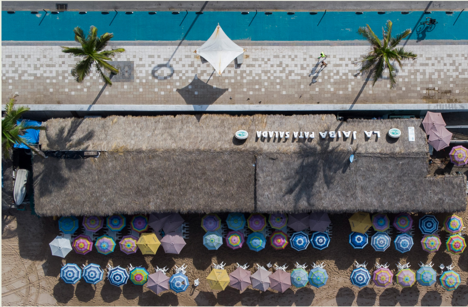
Malecón de Mazatlán, Mazatlán, Sinaloa. Foto: ITDP/Raquel Cunha 2022