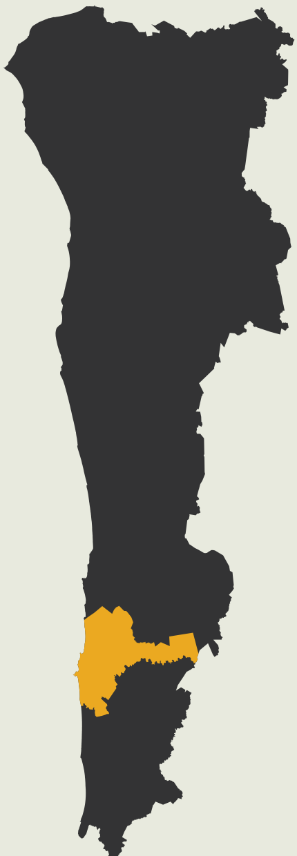
Figura 49. Municipio de Mazatlán, Sinaloa.