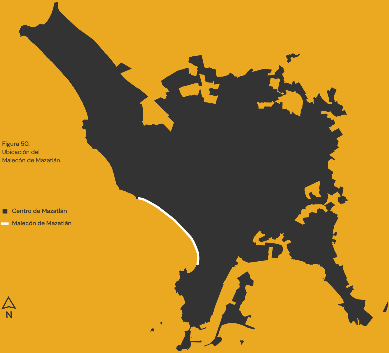
Figura 50. Ubicación del Malecón de Mazatlán.

Este proceso participativo ha permitido la implementación de la primera etapa de esta red municipal de ciclovías, conformada no solamente por el Malecón, sino también por otras vialidades importantes de Mazatlán.