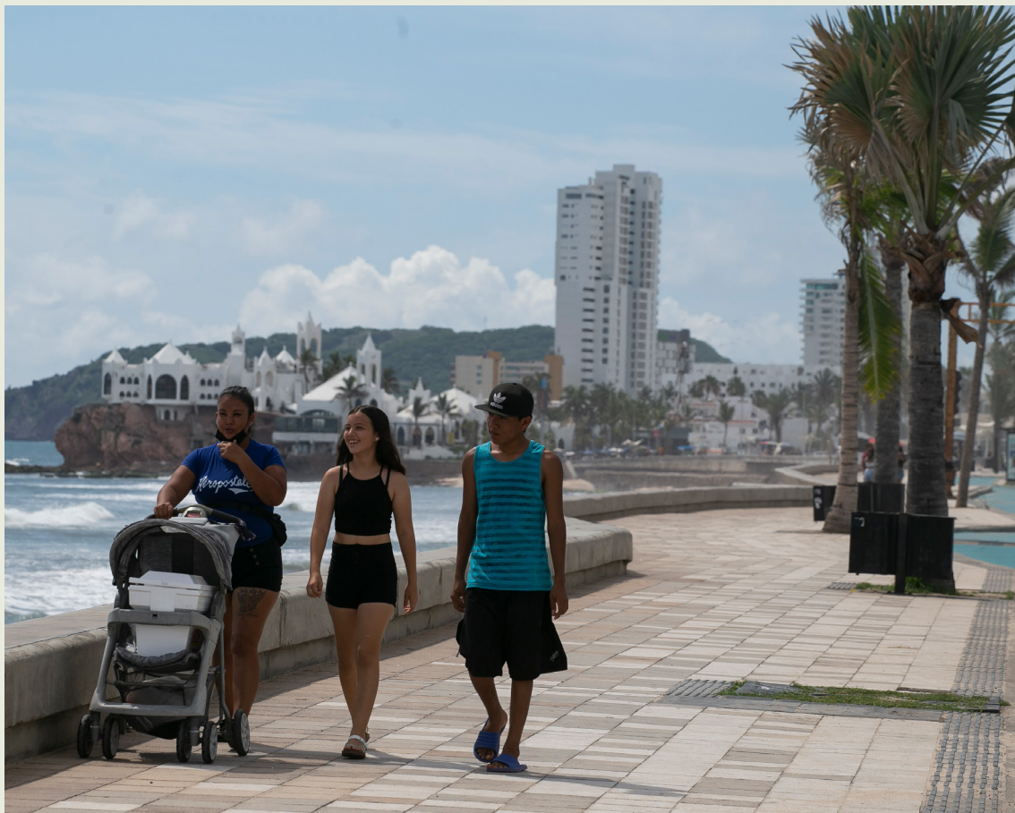
Malecón de Mazatlán, Mazatlán, Sinaloa. Foto: ITDP/Raquel Cunha 2022

La intervención del Malecón de Mazatlán permitió la revalorización de los modos activos en uno de los espacios más importantes de la ciudad, así como la ampliación de la red ciclista, a partir de un proceso participativo que reunió a una pluralidad de actores.