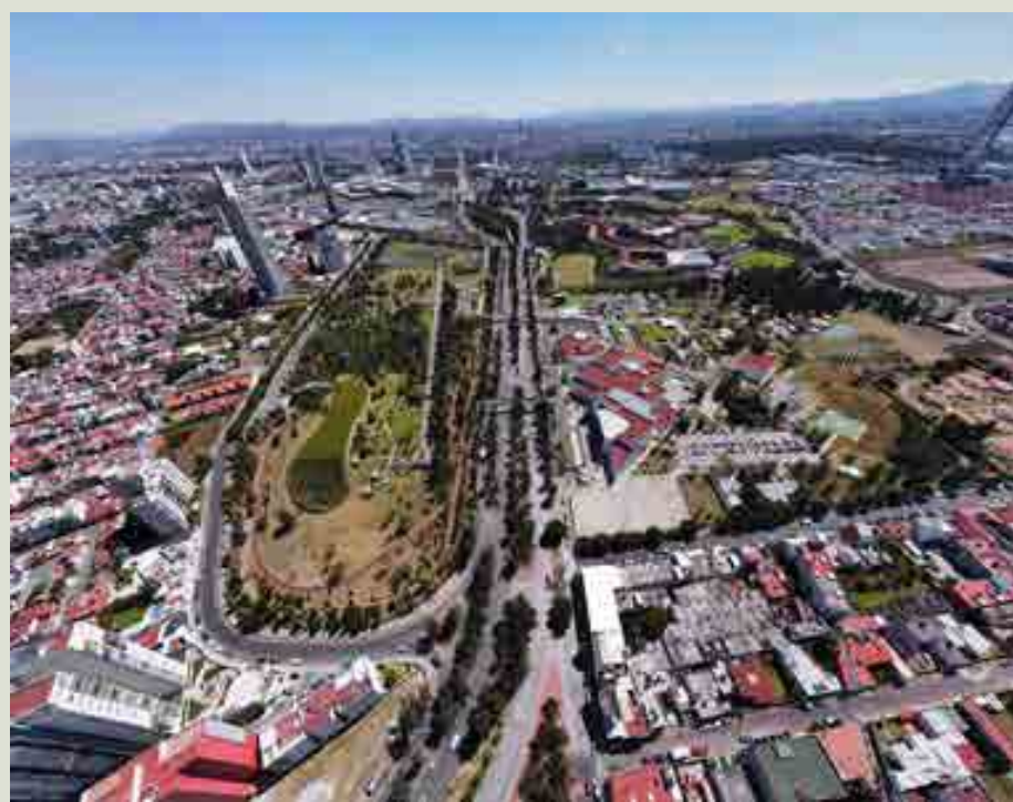
En la foto: Vista aérea de un tramo de Blvd. del Niño Poblano actualmente.

“La Dirección de Movilidad Motorizada se integra por un equipo multidisciplinario, donde se ve representada la arquitectura, diseño, urbanismo, ingeniería en transporte, comunicación, ciencias políticas y administración pública.”